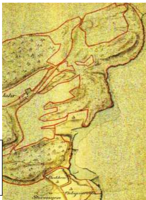
Figur UJ4: Et kart over Jarskogen tegnet av Reichsborn i 1817. Det viser to demninger, sager nedenfor begge og ei mølle under Jarfossen gjenkjennelig fra innsnevring av elva.