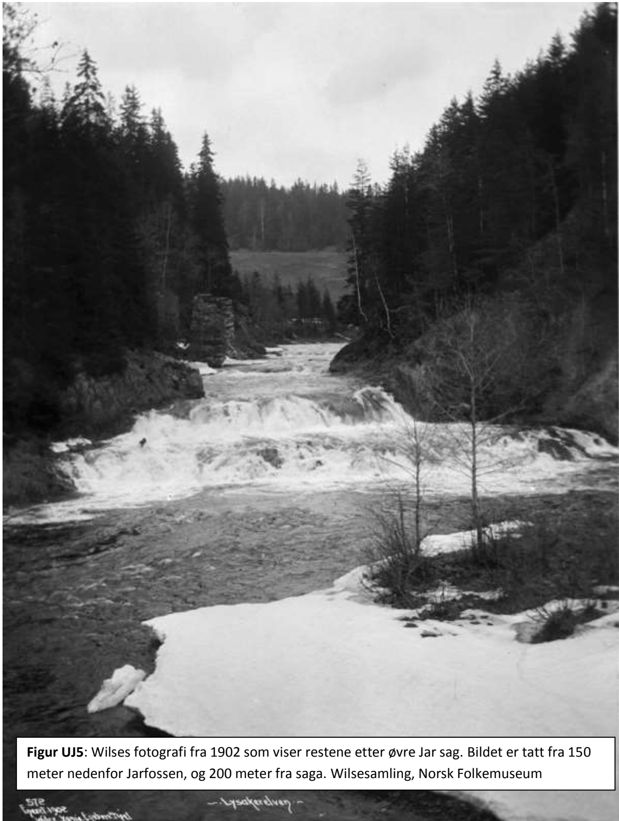
Figur UJ5: Wilses fotografi fra 1902 som viser restene etter øvre Jar sag. Bildet er tatt fra 150 meter nedenfor Jarfossen, og 200 meter fra saga.

Fotodokumentasjon: Wilse tok et bilde (Fig, UJ5) i 1902 fra plassen Ødegård nedenfor Jarfossen og vel 150 meter fra saga. Det viser to tørrmurte søyler i elvekanten og en støttemur i annen rekke.