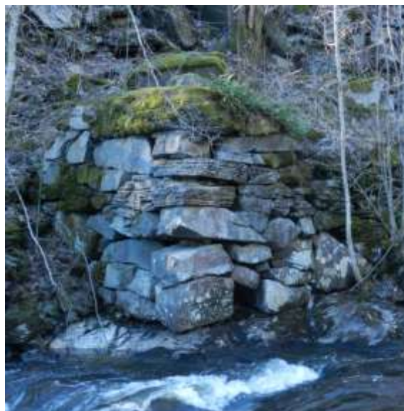
Figur UJ1: Bunn til steinsøyle ved elva i sør.

Kartdokumentasjon: Jar sagene og mølla vises bare på kart fra 1793, 1808 og 1818. Ingen av brukene står på kart fra 1864, men nedre saga står på kartserien Kristiania (Oslo) og omegn