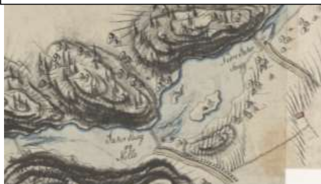
Figur UJ3: Utsnitt av kart 3555 i Nasjonalbibliotekets samling, datert ca. 1808, viser tre demninger ved Jar gårds grunn med rekkefølge to demninger-sag-mølle-demning-sag