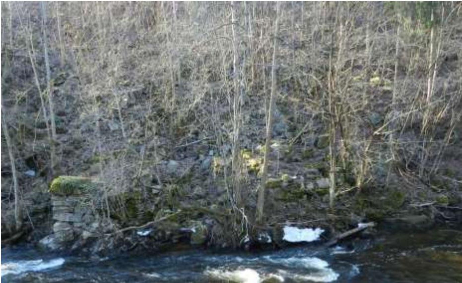
Figur UJ8: Restene etter øvre Jar sett østfra.

Demningsstedet er typisk for Lysakerelva med bruk av naturlig innsnevring på oslosiden og tilhogg i fjell på bærumsiden. Dette bør skiltes.