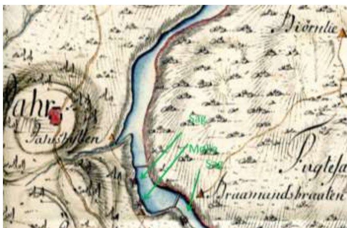
Figur UJ2: Kwartmiilskart i målestokk 1:10.000 fra oppmåling foretatt i åra 1793-7 med rekkefølget demning-sag-mølle-demning-sag langs Lysakerelva ved Jar