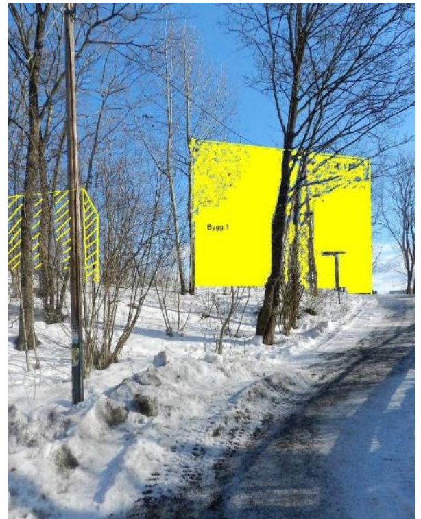
Bygg i felt B2 fra gangbrua ved Jar