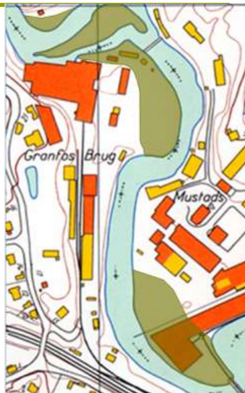
Flomsletter på Lilleaker og Granfos, 1987 på kart fra 1965

Slike samtaler er langt å foretrekke fremfor avtaler om å spytte penger i kommunekassen, men bare dersom man får sitt reguleringsforslag godkjent i bystyret. Slike samtaler øker sjansen for at Lysakerelva får beholde sine flomsletter. Slike samtaler kan redde en levende Lysakerelva nedenfor Fåbro.